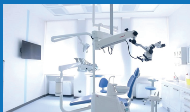
Impianti a contenuto tecnologico avanzato per Odontoiatri

I principali sbocchi occupazionali previsti dal corso di laurea della classe, include: industrie del settore biomedico e farmaceutico produttrici e fornitrici di biomateriali; apparecchiature per diagnosi, cura e riabilitazione aziende ospedaliere pubbliche e private; società di servizi per la gestione di sistemi digitali ad uso medico ed odontoiatrico tipo CAD/CAM di telemedicina; laboratori di ricerca specializzati sui biomateriali.