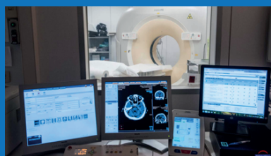
Tomografia Assiale Computerizzata TAC