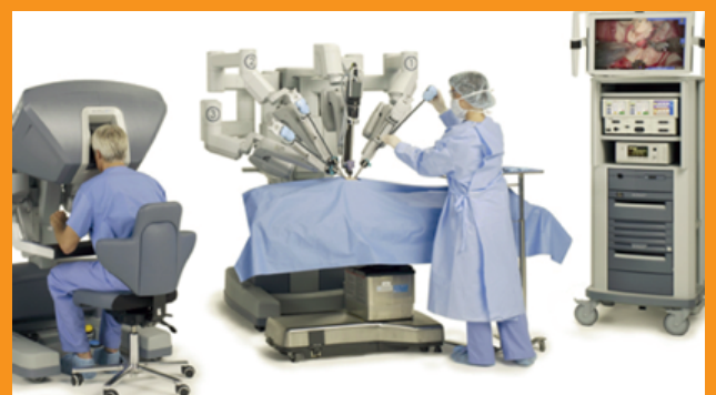
Robot Leonardo Da Vinci per Chirurgia minivasiva